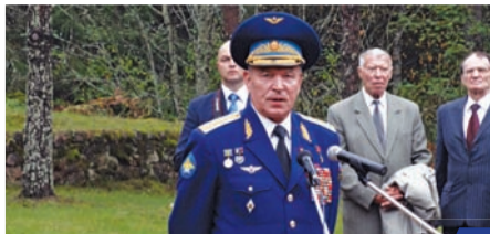
Визит делегации Героев в Беларусь