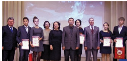
Герои в Земской гимназии