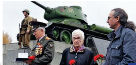
Москва за нами. 1941 год